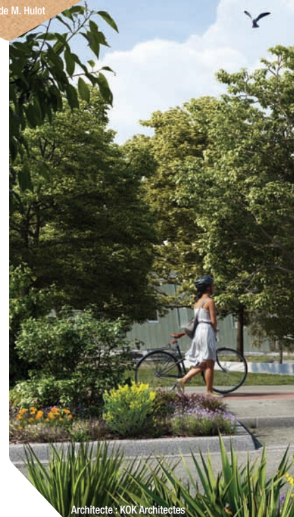
Architecte : KOK Architectes

Ses habitants aiment l'état d'esprit nazairien : une longue tradition de solidarité et le plaisir de vivre ensemble qui en fait un endroit très agréable pour s'y installer.