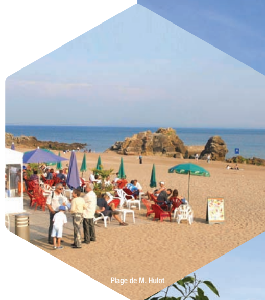
Plage de M. Hulot