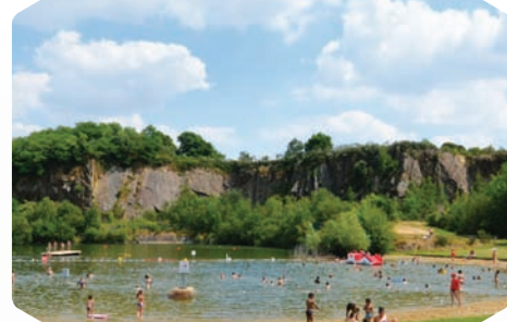
La Roche Ballue