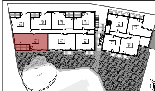
TABLEAU DE SURFACES :